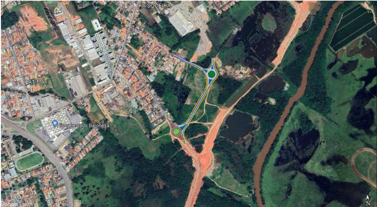
Figura 2 - Localização da via projetada