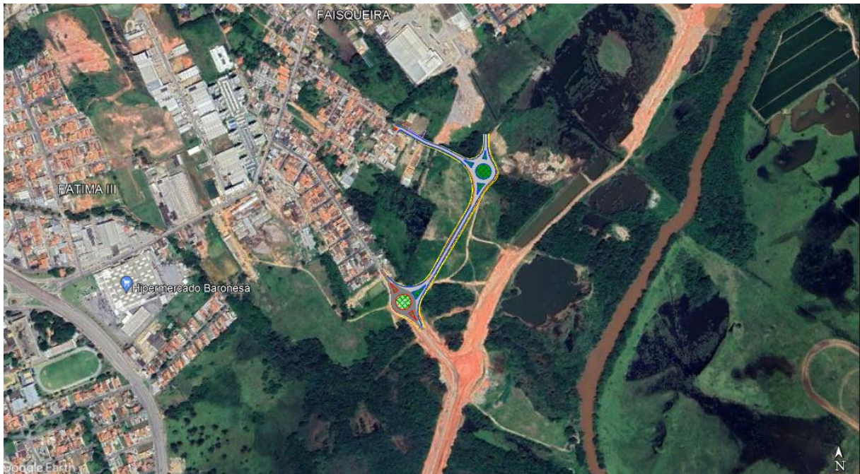
Figura 1 - Localização da via projetada